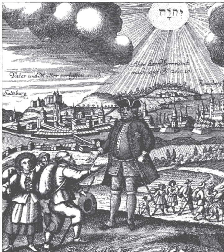
Karalius sveikina atvykusius Zalcburgo emigrantus

Esminis Frydricho Vilhelmo I nuopelnas dvasiniame gyvenime buvo jo proteguotas Pietizmas. Būdamas kalvinistas, valdovas iš esmės paskatino dvasinį liuteronų bažnyčios atsinaujinimą. Šiuo žingsniu jis neprieštaravo savo religiniams įsitikinimams. Ortodoksijos įsigalėjimas, kuris vyko po reformacijos vedlių mirties, apėmė ne tik liuteronų, bet ir kalvinistų bažnyčias. Tačiau pastarojoje jis nebūvo toks ryškus ir ilgalaikis bei įvairiaplanis, kokių jis išvirto tarp Liutero sekėjų. Čia jis pasiekė tokį mastą, kad net artimiausias Marty-