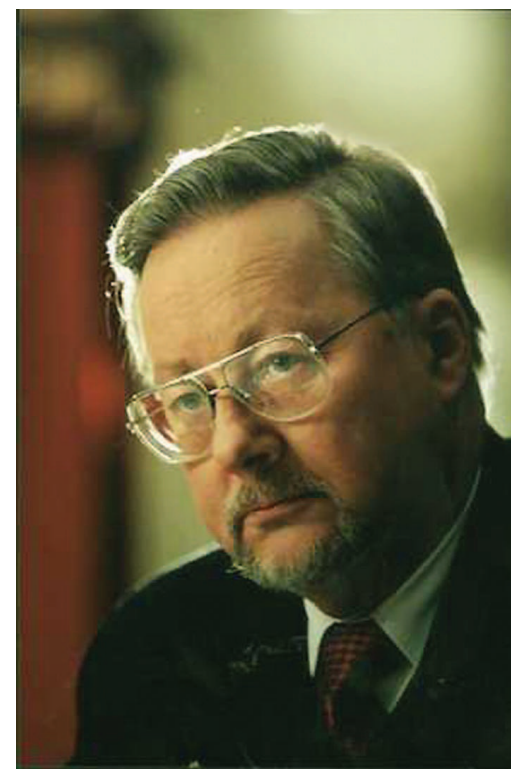
Prof. Vytautas Landsbergis