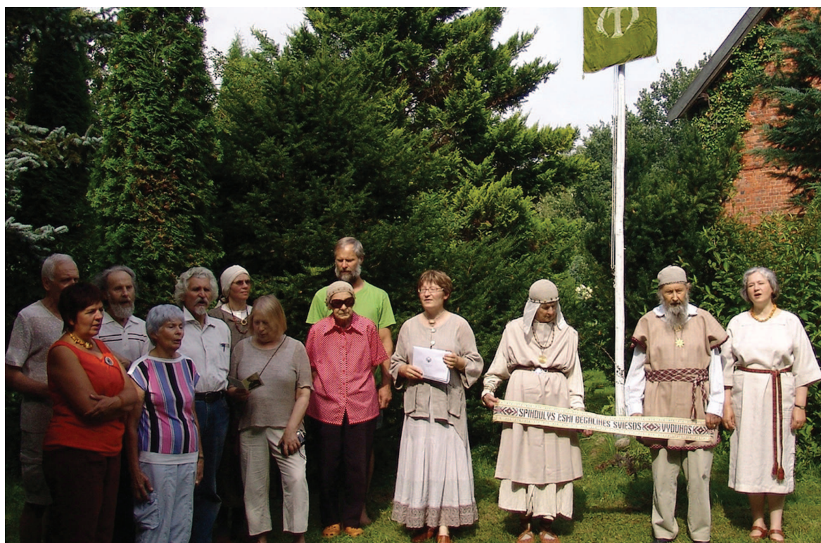
Vydūniečių stovyklos iškilmingas atidarymas Bitėnuose