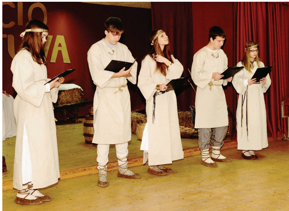
Prisistato projekto naujokai – Birštono gimnazistai

Mus ir toliau džiugina naujai prisijungiančios mokyklos – tai Birštono gimnazija ir Marijampolės savivaldybės Liudvinavo Kazio Bo-