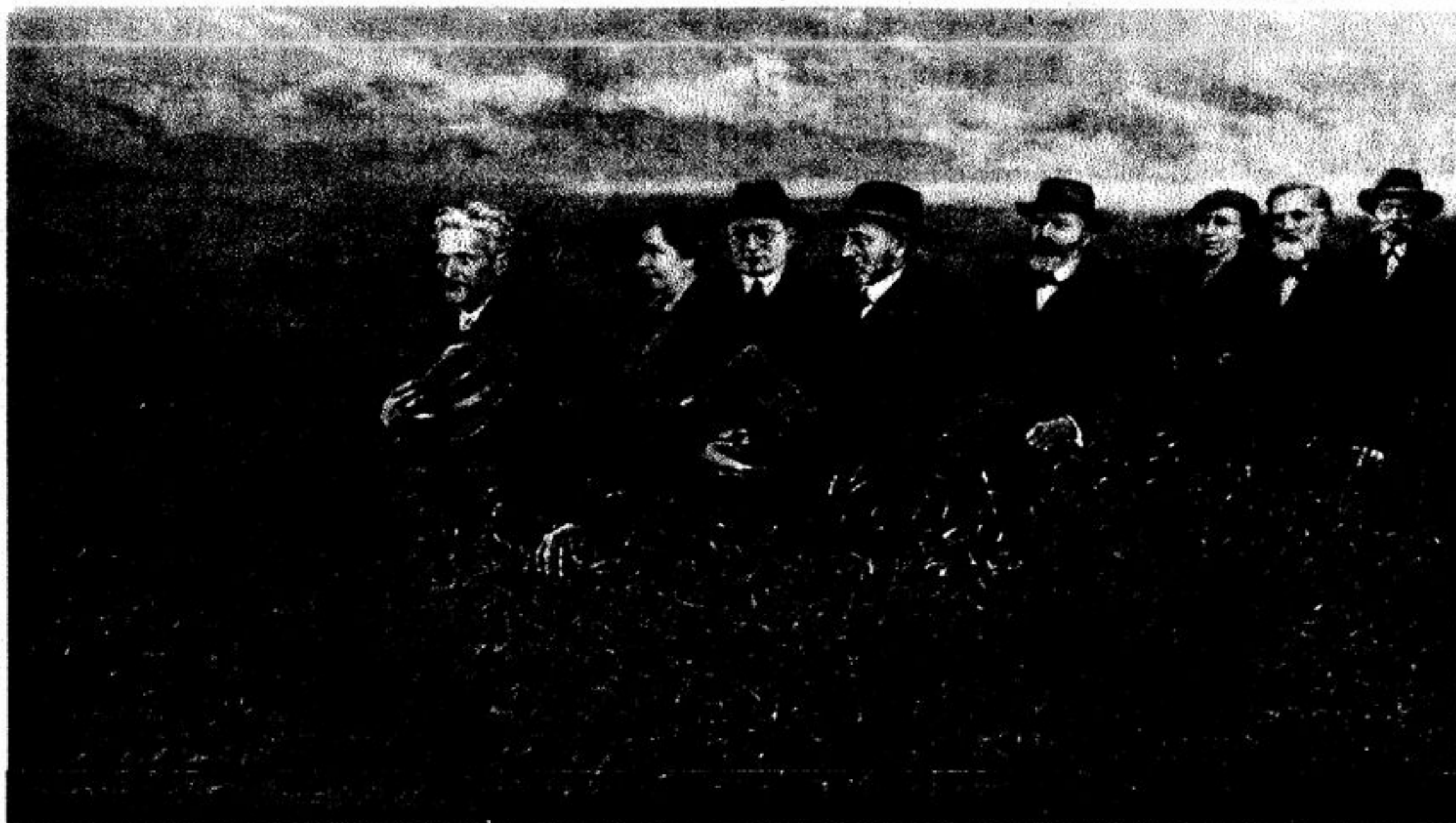
Pranas Griušys. Mažoji Lietuva. 1987 m.