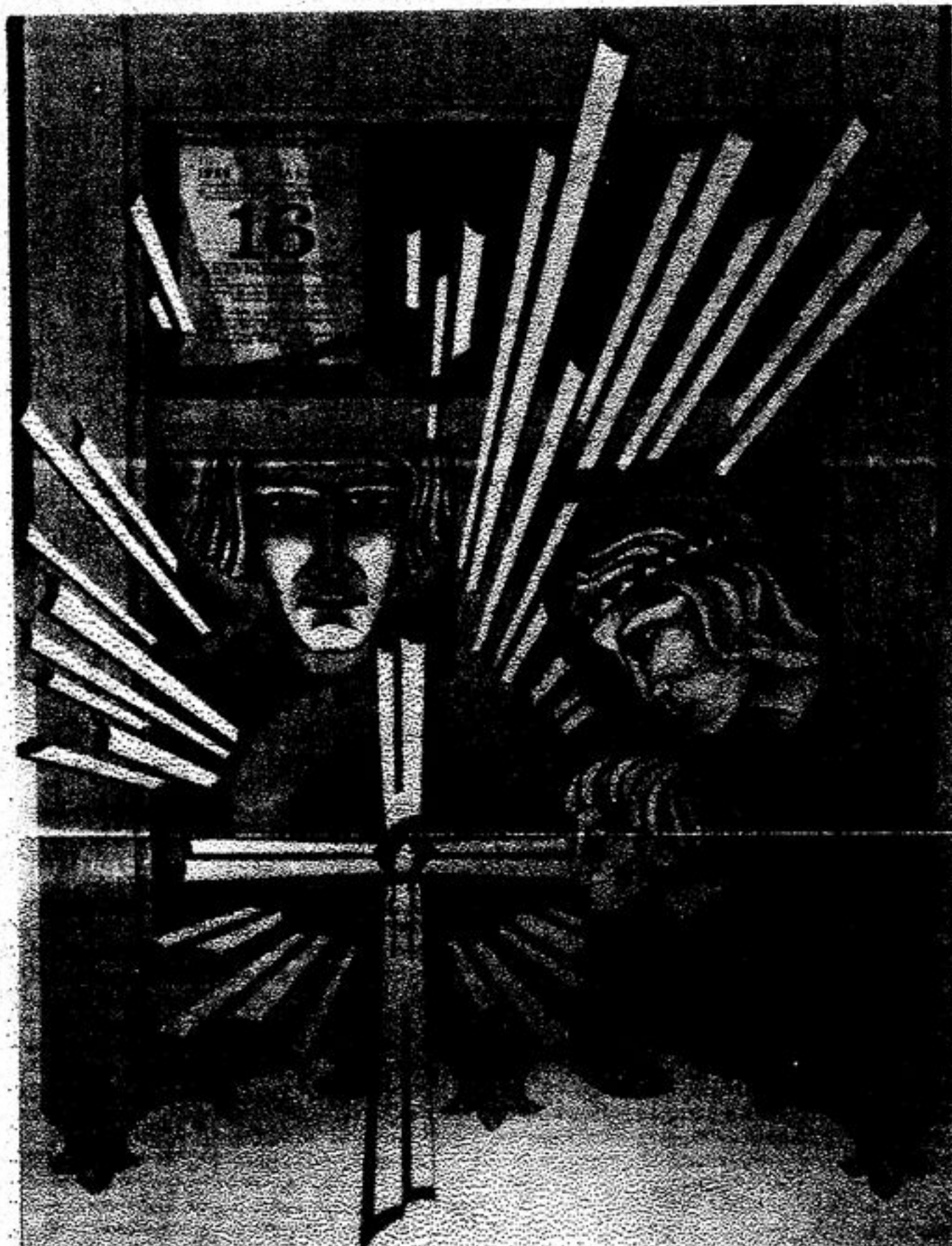
1989-ųjų metų Vasario 16-oji

Su skausmu širdyse Lietuvos žmonės sausio 13-ąją minėjo savo vaikų žūtį už Tėvynės laisvę ir Nepriklausomybę. “...Nemirtingumą ir amžiną šlovę suteikia tikrai Tėvynė...”